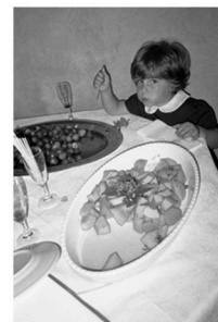
Guanche della verità San Leonardello, Sicilia 2006