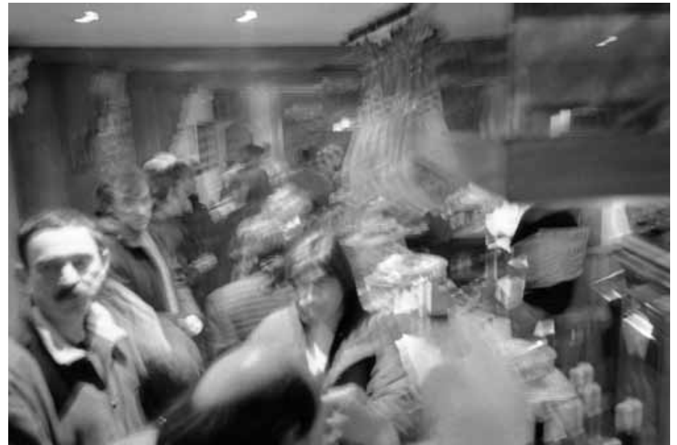
Claudio Falcone Movimenti di socialità Onati, Euskadi - 2004