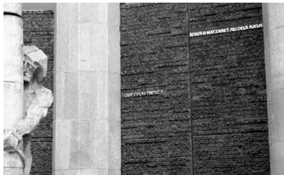
Claudio Falcone Dov'è la veritat? Barcelona - 2001